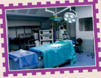
૩ મેજર ઓપરેશન થિએટર

ડોંબિવલી અને આજુબાજુના વિસ્તારમાં રહેતા રહેવાસીઓ માટે કોઈ પણ નાતજાતના ભેદભાવ વગર, ઉચ્ચ દરજ્જાની સારવાર અત્યંત રાહત દરે ઉપલબ્ધ કરવામાં આવે છે.