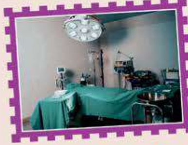
૧ માઈનર ઓપરેશન થિએટર